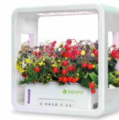
aspara® Stylist Lite